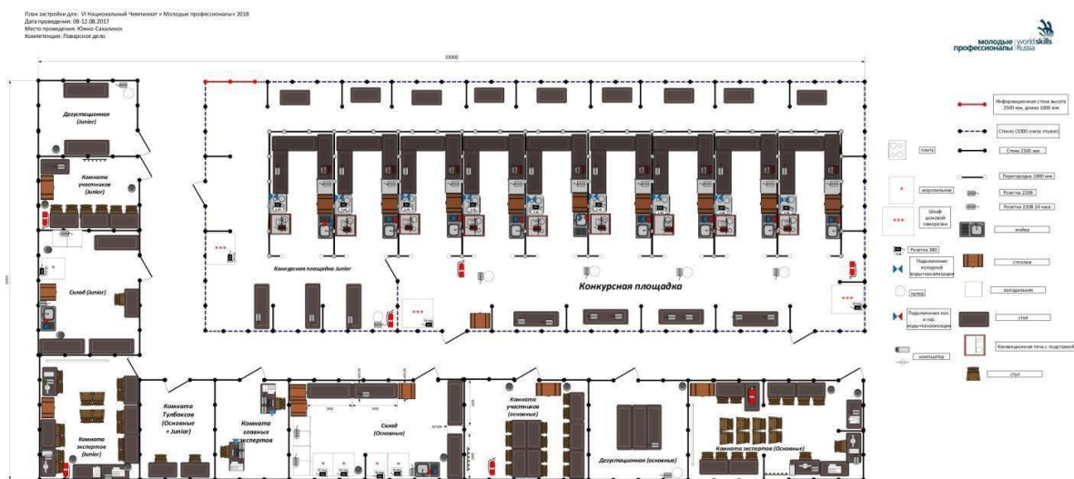
Схема конкурсной площадки (см. иллюстрацию).