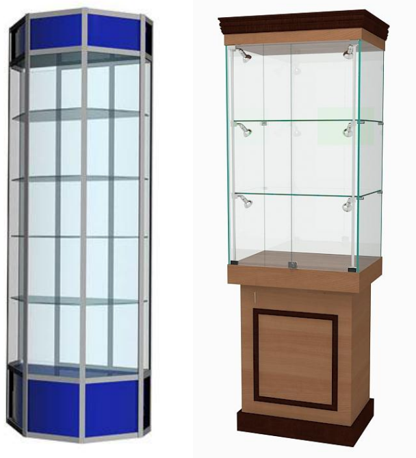
Примерный вариант: Витрина экспозиционная

Рис. 1. Модуль С «Разработка экскурсионных программ обслуживания / экскурсий», Модуль D «Проведение экскурсий»