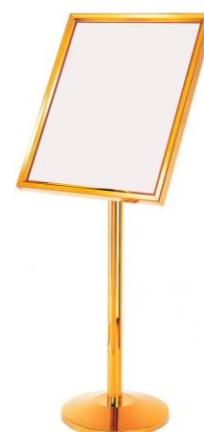
Примерный вариант: Стенд экспозиционный