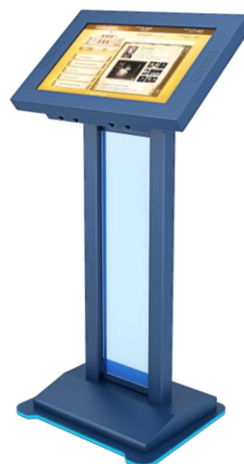
Примерный вариант: Интерактивный сенсорный стол/киоск